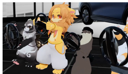
バーチャル「ハンドルぐるぐる体操」

町中心部から、避難解除区域を含む浪江町全域に拡大するほか、買い物支援サービスによる荷物配達を組み合わせた貨客混載の実証実験も実施します。昨年度の実証結果を踏まえ、移動サービスの利便性を向上することで、地方部における暮らしやすいまちづくりに貢献します。さらに同月、日産を含めた3社で、ローカル経済を回す新たな買い物・宅配モデル、「なみえバーチャル商店街サービス」の実証実験も開始しました。VR技術を活用し複数店舗のリアルタイム映像を見ながら商品選択できるシステムと貨客混載の効率的な配送を組み合わせ、簡単で便利な買い物・宅配サービスにより、地域経済の活性化を目指します。