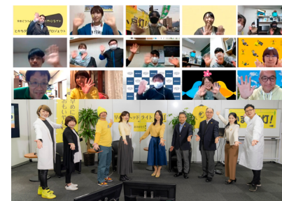
「TRY-LIGHT ONLINE フォーラム」

日産グローバル本社ギャラリーでは、年間を通して、ミスフェアレディが点灯呼びかけアクションに使うボードを掲げ「おもいやりライト運動」のプレゼンテーションを毎日夕暮れ時に実施しています。こうした活動を通じて、企業やNPO、クルマファンなどに理解と実行を促してきた結果、「おもいやりライト運動」は市民の間に着実に浸透しつつあります。