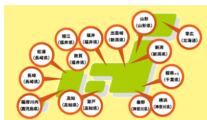
主体的に点灯呼びかけアクションを全国で実施

運動に賛同するコメントをいただくことができ、参加者同士のつながりが促進され、より一層活動を盛り上げることができました。