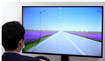
有効視野計測システム