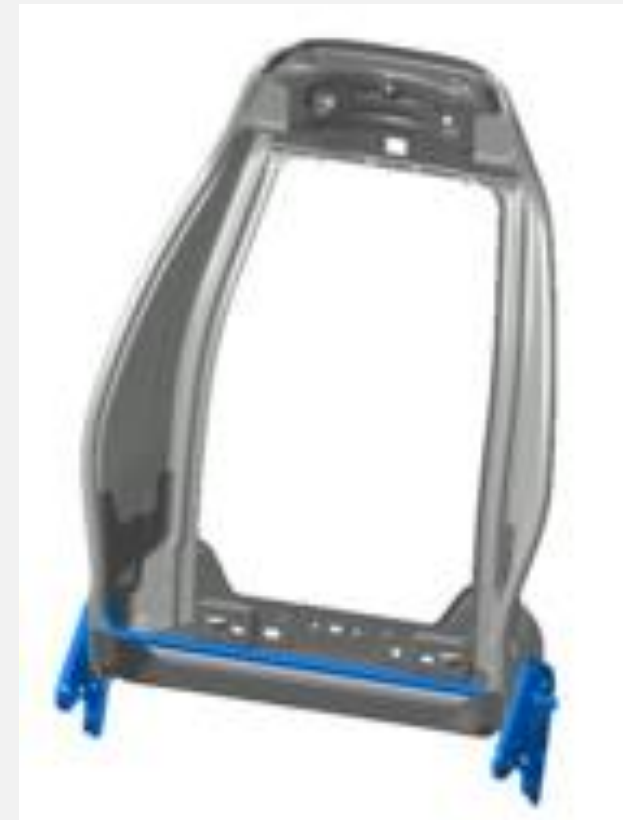
ハイテン材利用バックフレーム