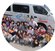
地域社会や 人びとへの貢献