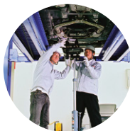
高品質な商品や サービスの創造