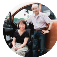
クルマをもっと身近に