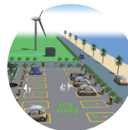
環境にやさしい クルマや街づくり