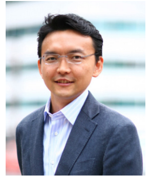
株式会社イースクエア 代表取締役副社長 東北大学大学院 環境科学研究科 非常勤講師

来年度のレポートでは、ゼロ・エミッション車のリーダーとして具体的な世界観を描き、全社を挙げてどのように実現を図ろうとしているのかということについて、本文を通してより語っていただきたい。有言実行を旨とし次世代を切り拓くリーディングカンパニーとして、今後の活躍に大いに期待している。