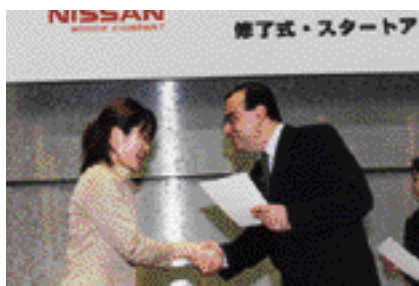
日産-NPOラーニング奨学金の授与式