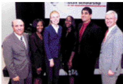
日産ミシシッピ奨学金プログラムの2002年度奨学生4名と、エミール・ハッサン北米日産取締役副社長(左端)とロニー・マスグローブ州知事(右端)

この奨学金プログラムには、若者の教育・生活レベル向上の手助けをしたいという当社の思いが込められています。また2002年度で5年目を迎える日産NPO奨学金制度は、文化・芸術、教育、国際交流、環境保全など、15分野の非営利団体(NPO)で活動する機会を日本の大学生や大学院生に提供しています。さらにスペインのカタロニア工科大学(UPC)に自動車の技術